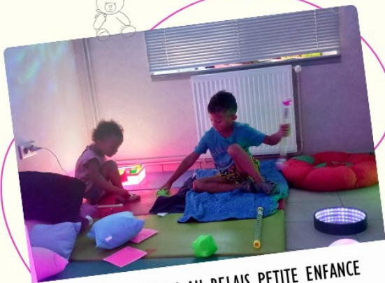
ATELIER SNOEZELLEN AU RELAIS PETITE ENFANCE