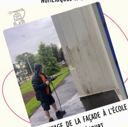
NETTOYAGE DE LA FAÇADE À L'ÉCOLE DE NUBÉCOURT