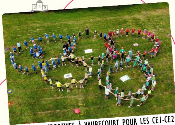
OLYMPIADES SPORTIVES À VAUBECOURT POUR LES CE1-CE2 DES 5 GROUPES SCOLAIRES - VENDREDI 28 JUIN