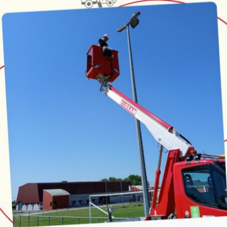
SEUIL D'ARGONNE - STADE REPLACEMENT DES LUMINAIRES