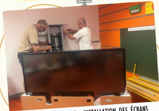
PIERREFITTE SUR AIRE - INSTALLATION DES ÉCRANS NUMÉRIQUES À L'ÉCOLE