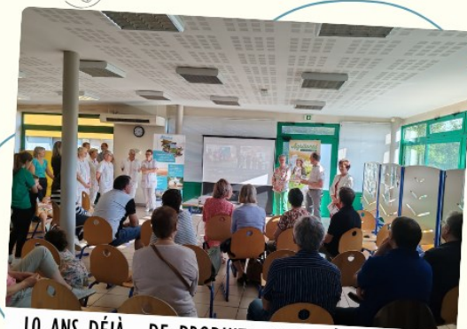
10 ANS DÉJÀ... DE PRODUITS LOCAUX À LA CUISINE CENTRALE - VENDREDI 7 JUIN