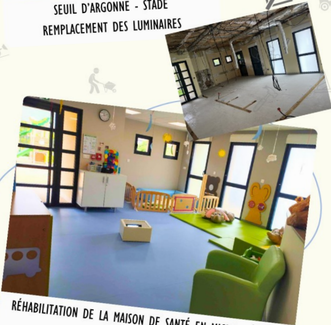
RÉHABILITATION DE LA MAISON DE SANTÉ EN MICRO-CRÈCHE À REMBERCOURT-SOMMAISNE