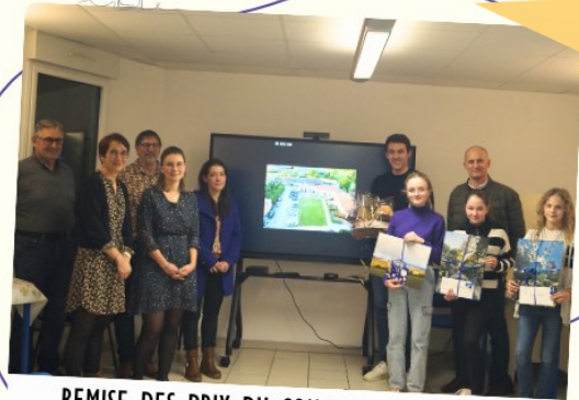
REMISE DES PRIX DU CONCOURS PHOTO PLUI MARDI 13 FÉVRIER