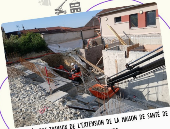
AVANCÉE DES TRAVAUX DE L'EXTENSION DE LA MAISON DE SANTÉ DE PIERREFITTE SUR AIRE