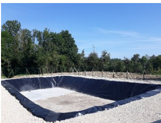
Bassin de rétention