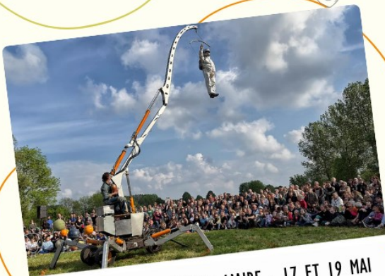
FESTIVAL MA RUE PREND L'AIRE - 17 ET 19 MAI