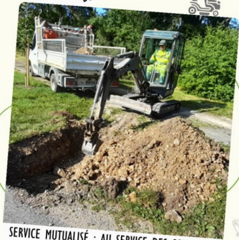
SERVICE MUTUALISÉ : AU SERVICE DES COMMUNES ICI CRÉATION D'UN AVALOIR PLUVIAL À VILLE DEVANT BELRAIN