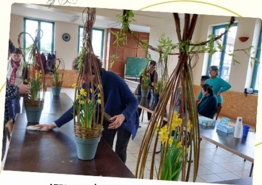
ATELIER SÉNIORS - MARDI 16 AVRIL