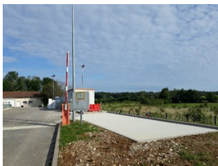
Dalle de stockage

UN DOUTE SUR LE TRI DES DÉCHETS ? Téléchargez l'application « SMET au tri » sur Google Play ou l'App store.