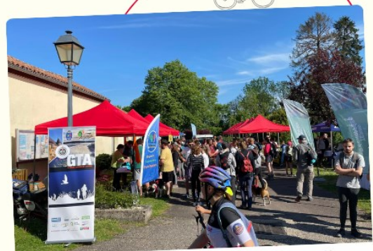
LA GRANDE TRAVERSÉE DE L'ARGONNE (GTA) DU 8 AU 15 MAI