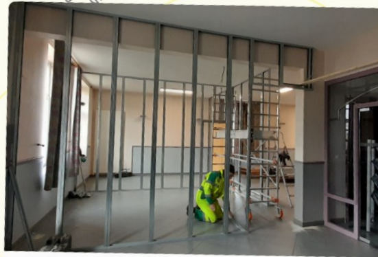
PIERREFITTE SUR AIRE - CRÉATION DE LOCAUX PROVISOIRES DANS LA MAIRIE POUR LES PRATICIENS DE LA MAISON DE SANTÉ