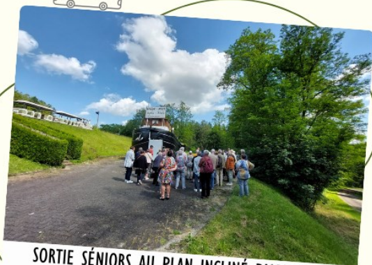
SORTIE SÉNIORS AU PLAN INCLINÉ D'ARZVILLER VENDREDI 7 JUIN